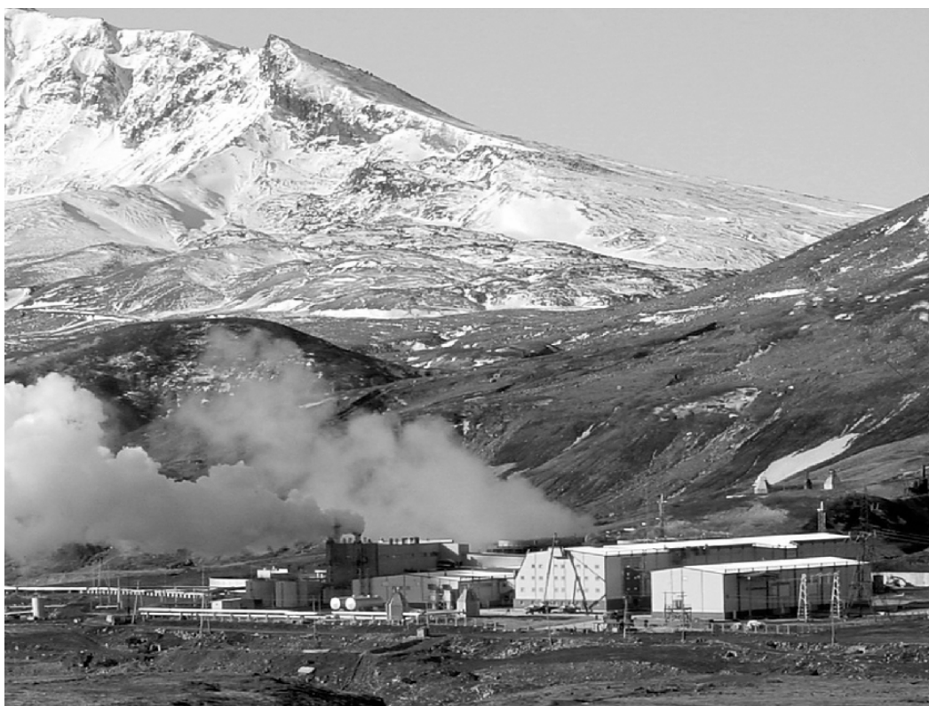
Рис. 3. Мутновская ГеоЭС и вулкан Мутновский на заднем плане.

Вместе с тем, условия сосуществования активных вулканов и гидротермальных систем до сих пор не вполне понятны. Мутновское геотермальное месторождение и кратерные фумарольные поля Мутновского вулкана располагаются всего в 8 км друг от друга, тяготея, по-видимому, к одной и той же трещинной зоне повышенной проницаемости, которая служит каналом для транспорта и магм, и термальных флюидов. Возможен ли рост мощности теплового питания геотермального месторождения при его эксплуатации за счет энергетического потенциала Мутновского вулкана и можно ли таким способом повлиять на его активность – проблема, требующая дальнейшего изучения (рис. 3).