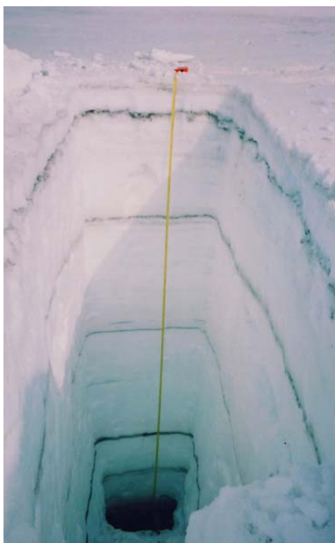
Рис. 1 Отложения вулканического пепла в снежной толще на полуострове Новогоднем в апреле 2005 г.

2. В период, когда вода в озере покрыта льдом и снегом, пепел, попадая на акваторию озера, накапливается в снегу. На рис. 1 показаны пепловые горизонты в толще снега; шурф выкопан на полуострове Новогоднем в апреле 2006 года. С таянием льда и снега, примерно в течение месяца весь накопленный за зиму пепел попадает в озеро. Если предположить, что в активный период вулкана пепел выпадает равномерно зимой и летом, то зимний пепел может образовывать на дне озера однородные слои. В этих сезонных слоях может находиться до половины пепла выпавшего за сезон.