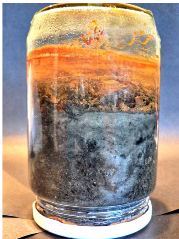
Рис. 2. Слои в донных отложениях. Керн взят на дне кратера Токарева в 2005 г.

Эта оценка весьма груба, так как весной течения в озере не менее, а то и более активны, чем в другое время года, в связи с обильным таянием снега. Кроме этого, пепел выбрасывается вулканом весьма неравномерно по времени. Однако, эти сезонные колебания накопления пепла могут быть заметны в течение достаточно длительного периода активности вулкана. В кернах взятых на дне кратера Токарева в 2005 году видны слои в рыхлых отложениях (рис. 2), которые могут быть связаны с описанными сезонными особенностями накопления пепла.