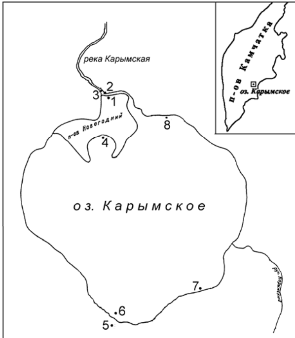
Рис. 1. Схема расположения точек отбора газовых проб: 1- ручей Горячий, точка № 1; 2 – правый берег р. Карымской, (источник № 3); 3 – источник «Бурлящий»; 4 – пляж кратера Токарева; 5 – источники Академии наук, восточная ванна; 6 – выходы в озере около источников Академии наук; 7- бухта «Желанная»; 8 – Медвежий пляж.

5, 10]. Эта зона включает плейстоценовые вулканы Академии Наук и Лагерный, голоценовый вулкан Карымский и современный кратер Токарева с его отложениями. Ранее известные источники кальдеры Карымского вулкана, расположенного в 6 км. севернее озера, также примыкают к этой зоне (но, расположены в нескольких сотнях метров западнее ее оси и, возможно, приурочены к оперяющим трещинам).