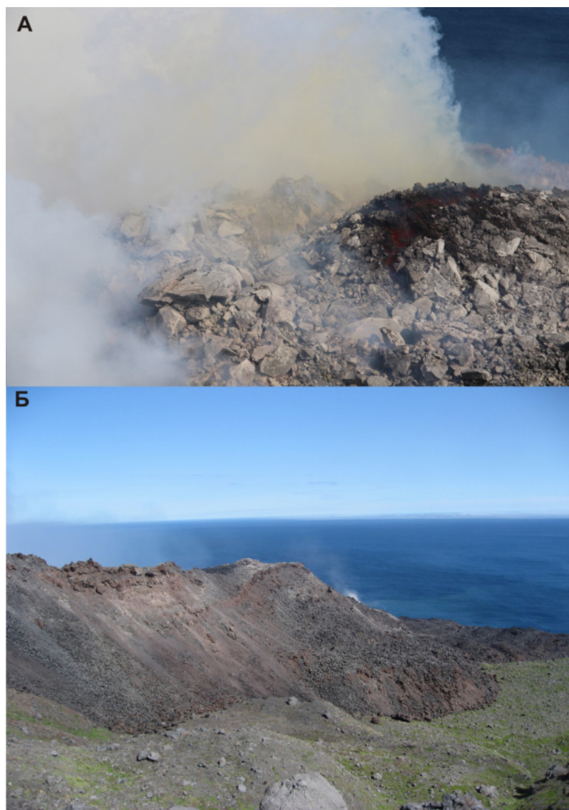
Рис. 3. Вулкан Сноу: экструзивный купол (а), лавовый поток (б)