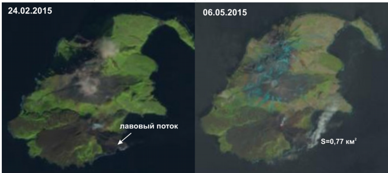
Рис. 2. Активность вулкана Сноу по спутниковым снимкам Landsat 8

В хорошую погоду 2 августа с берега и борта теплохода периодически наблюдались взрывы, сопровождавшиеся парогазовыми выбросами высотой до 1,6 км. Всего за один день наблюдалось два сильных выброса в 13.40 и 18.50 и около десяти слабых, сопровождавшихся сильным гулом (рис. 4).