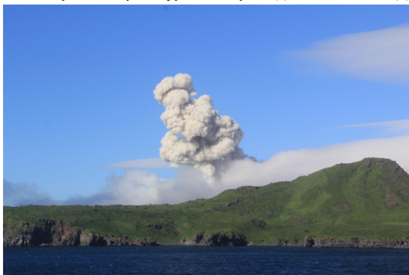
Рис. 4. Парогазовый выброс из вулкана Сноу 2 августа 2015 г.