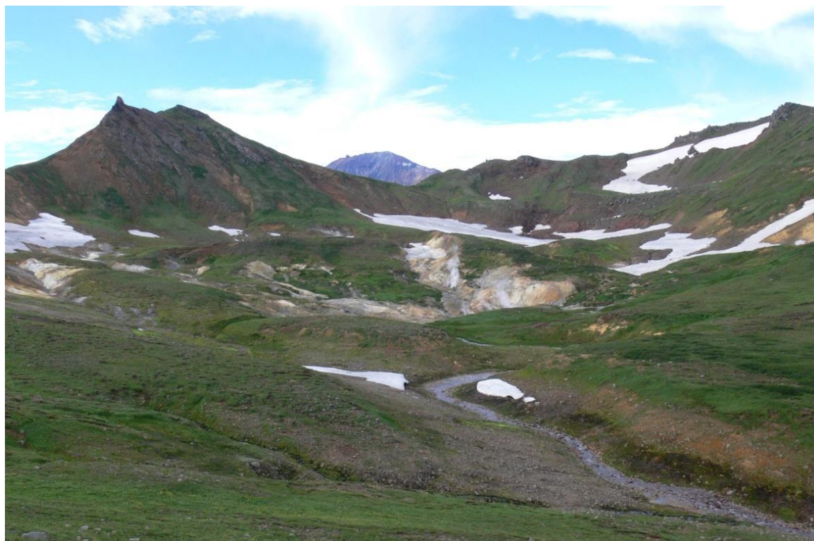
Рис. 1. Южно-Камбальное Центральное термальное поле. Вид с севера. Вдали – вулкан Камбальный.

ЮКЦ локализовано в кольцевой морфоструктуре: центральная часть представляет собой термальное поле, выделяющееся куполообразной структурой интенсивно аргиллизированных пород; по периферии в форме гребня протягиваются останцы лав андезитов (рис. 1). Такая морфоструктура постройки, приуроченность разгрузки тепла к ее центру и наличие уходящей на глубину субвертикальной зоны повышенной электропроводности среды, которая может служить подводящим каналом геотермального теплоносителя (неопубликованные данные вертикального электрического зондирования С.О. Феофилактова и др.), – все это свидетельствует в пользу расположения ЮКЦ в эрозионном кратере небольшого андезитового вулкана. А.С. Нехорошев, В.Л. Сывороткин и другие исследователи выделяют в этой части Камбального хребта крупный плиоцен-плейстоценовый стратовулкан Термальный (Северный Камбальный), осложненный множеством мелких вулканических построек [5, 7].