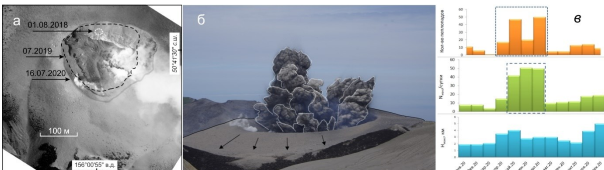
Рис. 2. (а) – КК 16 июля 2020 г., аэрофотосъемка с высоты 250 м. Контуры показывают предыдущие размеры кратера. (б) – Начало взрыва 29.06.2020 г. с множеством неоднородных струй (белые контуры), (в) – Диаграммы количества пеплопадов в месяц, максимального количества взрывов в сутки, максимальной высоты пепловой колонны над кратером.

Повторная аэрофотосъемка была выполнена через год, 16 июля 2020 г.: на плановом снимке, выполненном с высоты 250 м над кратером, штриховыми линиями показаны контуры КК 1.08.2018 г. и 14.07.2019 г. (рис. 2а).