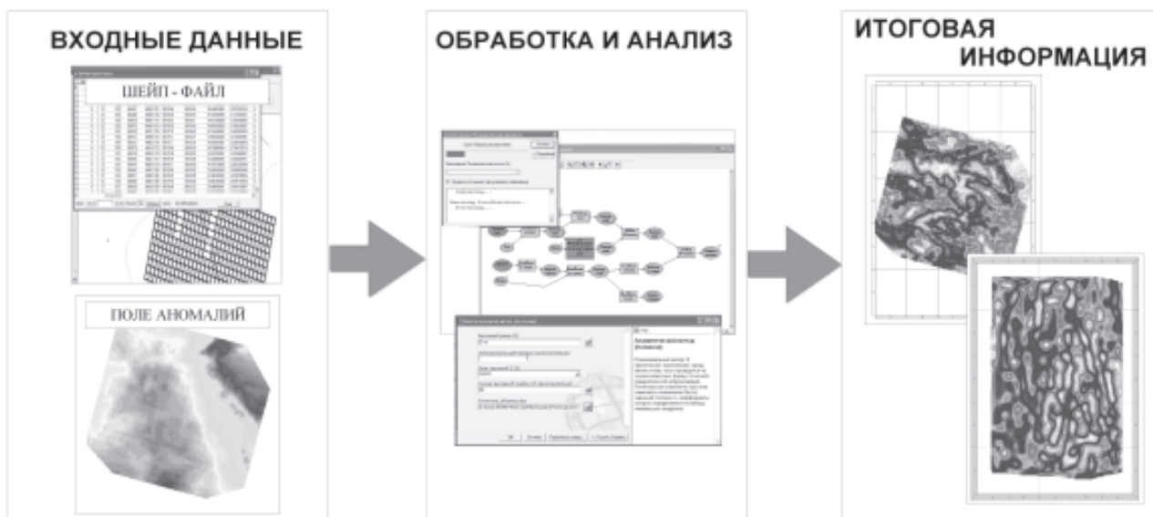
Рис. 3. Итоговые трансформанты гравитационного поля.

На стадии обработки и анализа данных система позволяет производить различные пре-