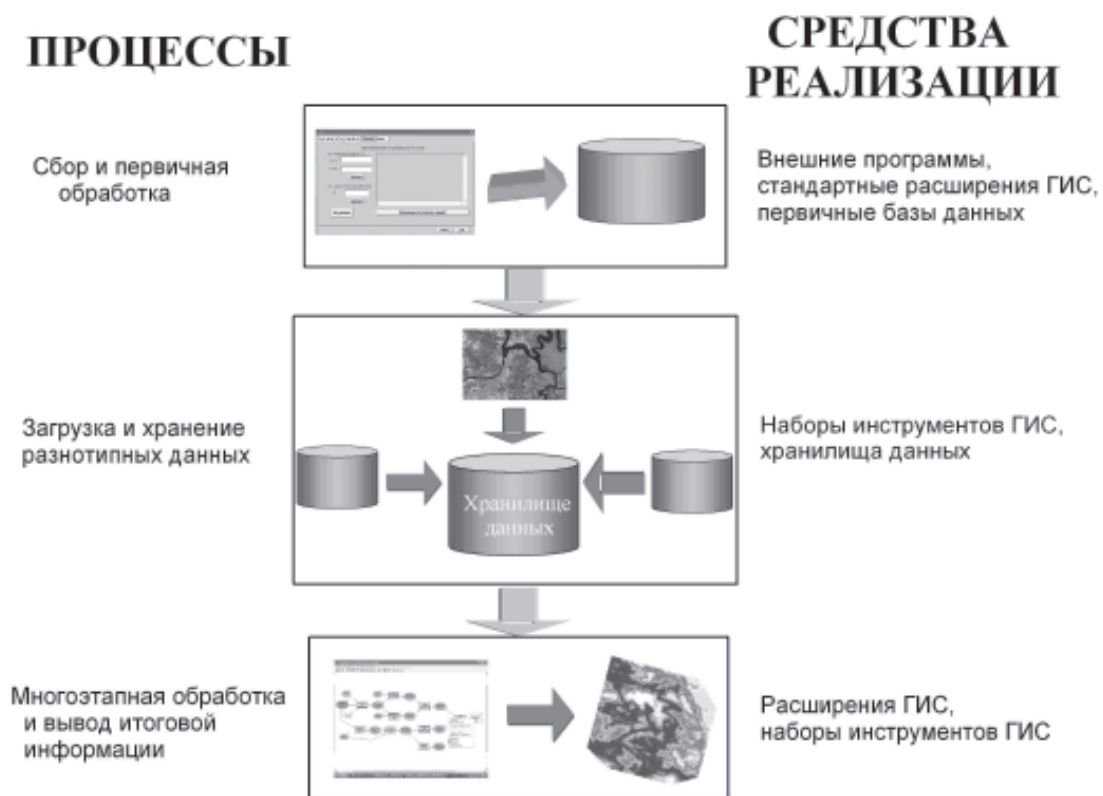
Рис. 1. Архитектура информационно-аналитической системы.