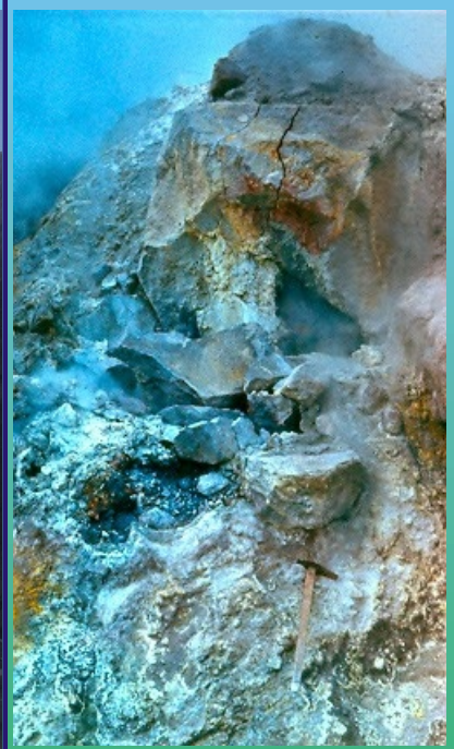
Иллюстрация к статье Вергасовой Л.П. “Об алунизации .....”